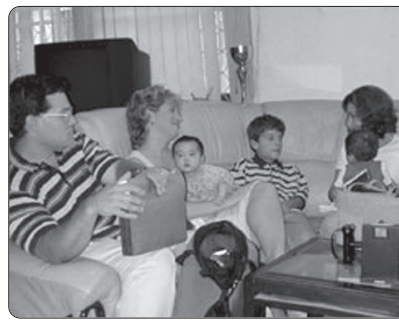
Ora 21.00 .....