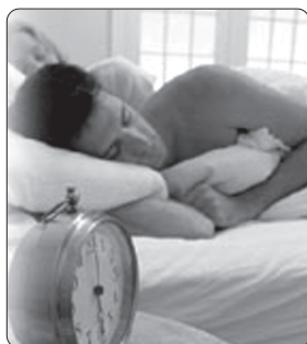
Ora 6.45..... Ora 7.00.....