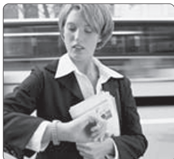
Ora 7.30 .....