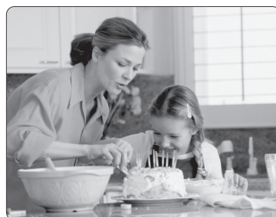
Ora 17.30 .....