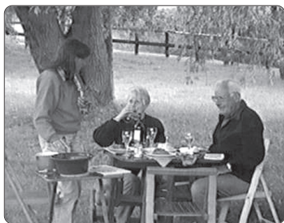
Ora 19.45 .....