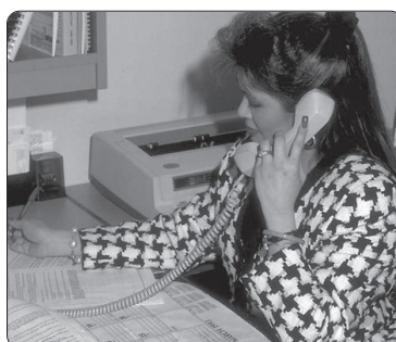
De la ora 8.00 până la 17.00 .....