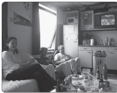
Ora 20.00 .....